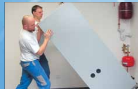
Tepelnou centrálu postavít a umístit na správné místo