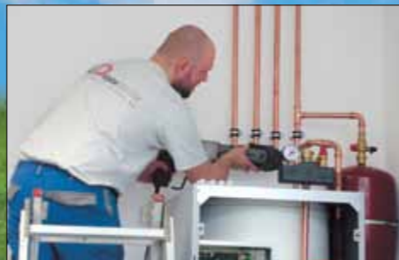
Finální připojení tepelné centrály