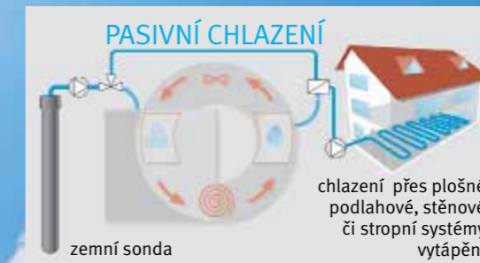
Tak to funguje!

Pasivní chlazení je cenově velmi příznivé řešení pro využití nízkých teplot země pro ochlazení místností v létě na příjemnou teplotu.