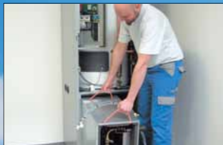
Nasunutí chladicího boxu do tepelného čerpadla