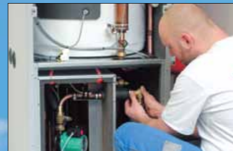
Připojení chladicího boxu