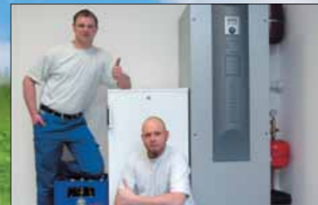
Hotovo! Jednodušeji to nejde!