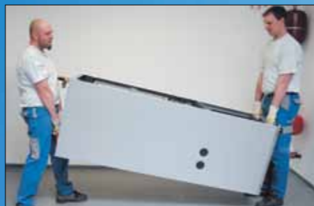
Jednoduchý transport díky vyjímatelnému chladicímu boxu

Technika tepelných čerpadel Alpha-InnoTec je obzvláště efektivní a komfortní nejen v provozu, ale ve srovnání s jinými dodavateli na trhu. Je i její transport a instalace značně jednoduchá!